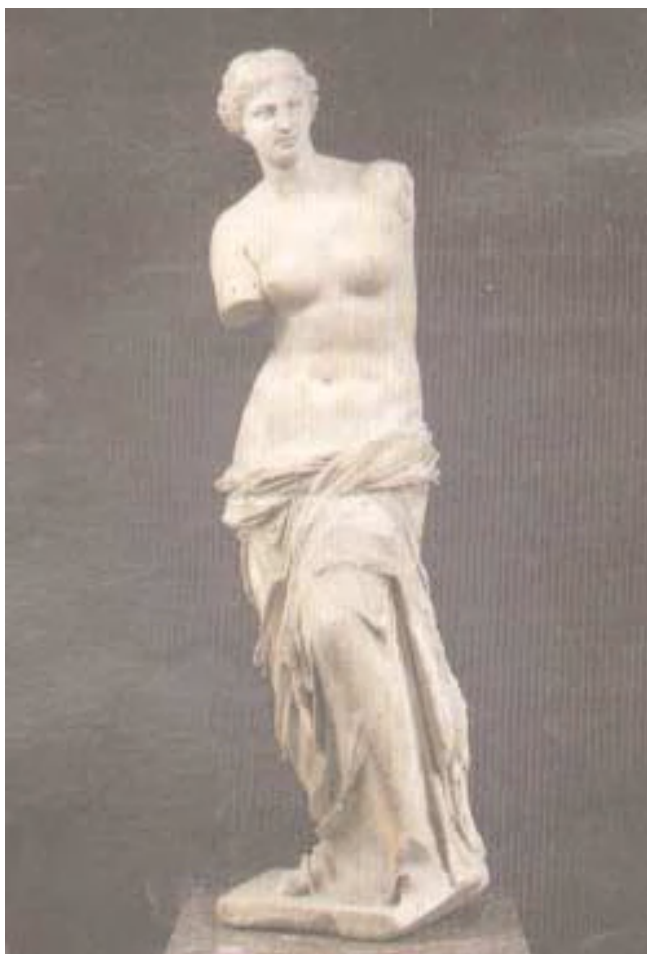
Венера Милоска. Личността Pulsatilla е мека, чувствена, съблазнителна и те предизвиква да я приласкаеш.

плачливи и евентуално анемични, с оскъдни, бледи менструации, с прекалено закъсняване на менархето. Медта и желязото са от жизнена важност за образуването на кръвта. Sulfurum, подобно на Pulsatilla, е лекарство за силни болезнени крампи по време на менструация, а също и за неблагоприятните последици от потисната или закъсняваща менструация, което може да се получи след плуване в студена вода или намокряне на краката. И двете лекарства са показани при персистираща анемия и неблагоприятни последици от приемане на прекалено големи количества желязни тоници, т. е. при злоупотреба с желязо, а ако прибегнем до символичното тълкуване на това – от прекалена изява на шовиниста или женомразеца Марс, т. е. в случаи на малтретиране от страна на любовник, баща, брат, син, било то емоционално, физическо или сексуално.