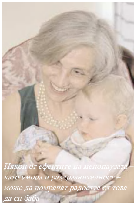
Някои от ефектите на менопаузата – като умора и раздразнителност – може да помрачат радостта от това да си баба

че се разплаквам много лесно, една от тях ме нарича ‘лейка’. Това много ме наранява. Настроенията ми се менят много рязко. Аз се опитвам да го скрия, защото искам приятелките ми да стоят при мен, но не мога да спра